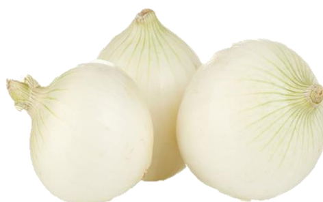
CEBOLLA BLANCA DULCE