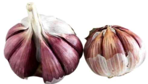
AJO MORADO PEDROÑERAS